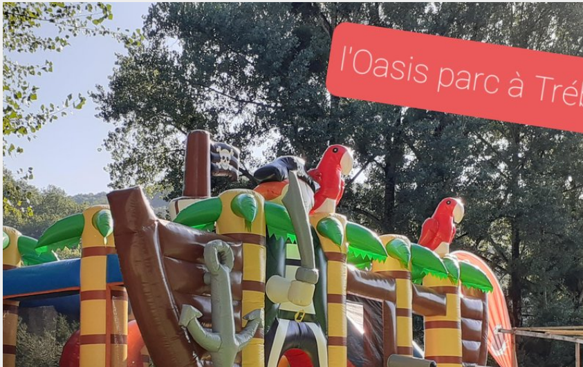
Crédit : Structures gonflables (l'Oasis parc enfants à Trébas-Tarn)