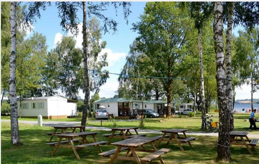
Lac de Villefranche de Panat