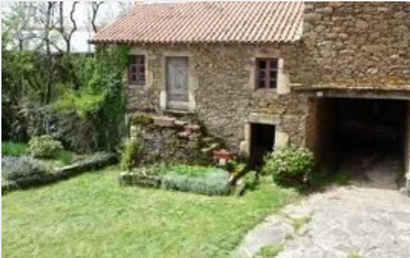
Gîte rural - AYG8025