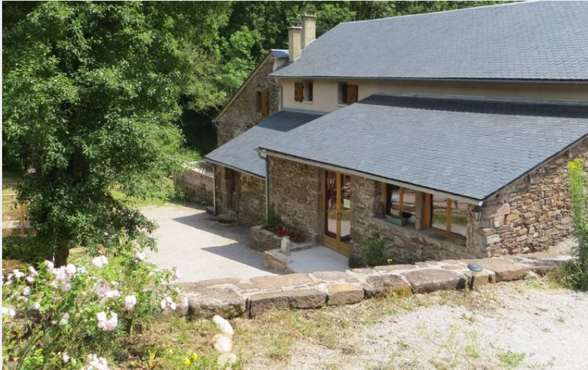
Crédit : Gîte de groupe à Riac (Office de Tourisme Rougier d'Aveyron Sud)