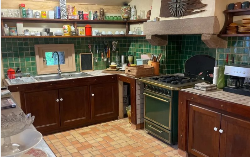
Crédit : Cuisine d'été mise à disposition des hôtes