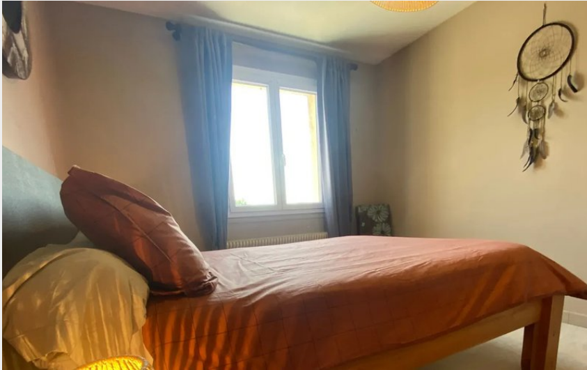
Crédit : Chambre 1 rez-de-chaussée