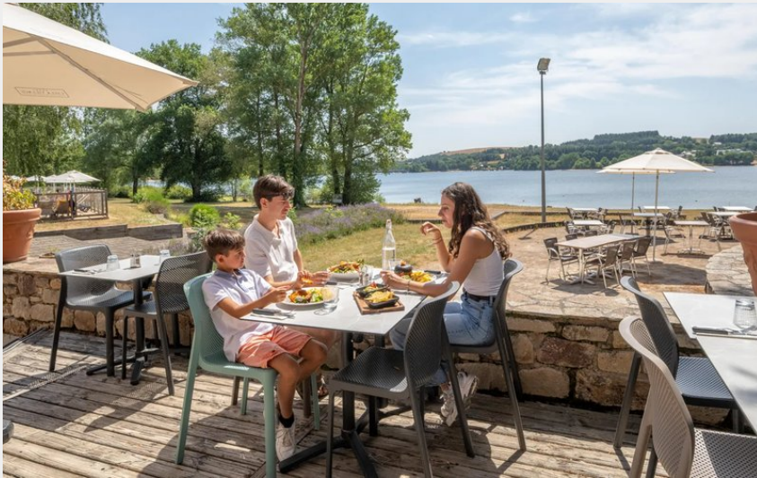
Crédit : Terrasse restaurant avec vue sur le lac (Camping Le Caussanel - Ciela Village)