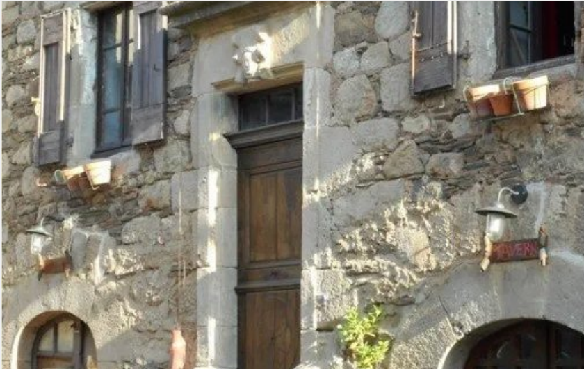
Crédit : The Tavern (OFFICE TOURISME DU PAYS DE LA MUSE ET RASPES DU TARN)