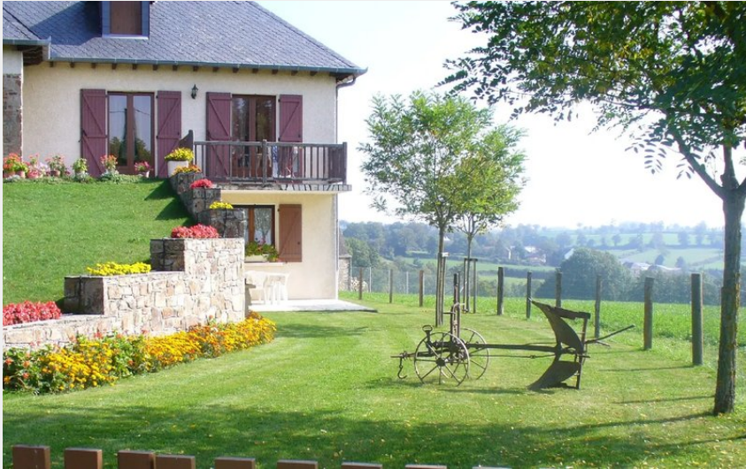
Crédit : Location Mme Guitard à Comps - jardin clos (Mme Guitard à Comps)