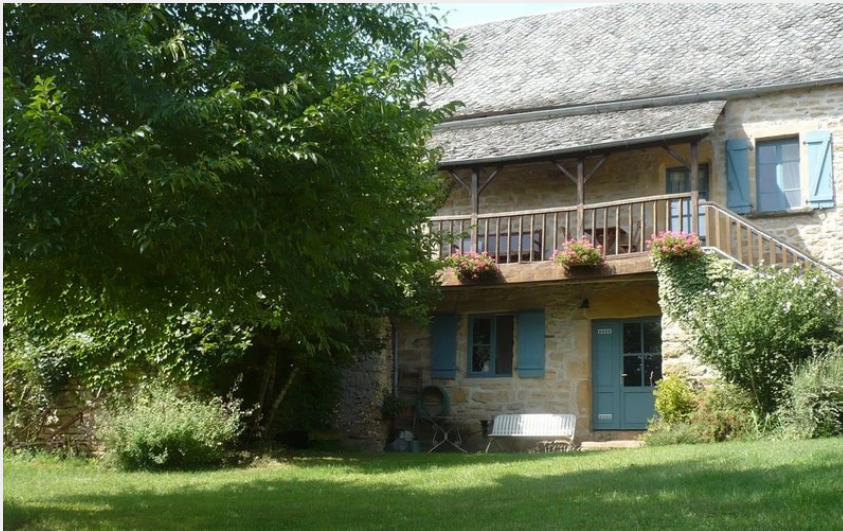
Le Causse - Gîte de Coubisou - Extérieur 3