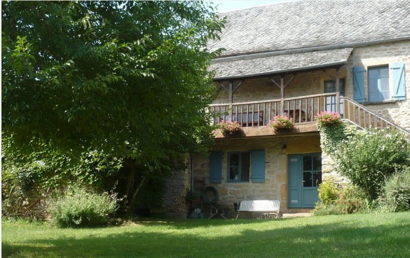
Crédit : Le Causse - Gîte de Coubisou - Extérieur 3 (Michel Bories)