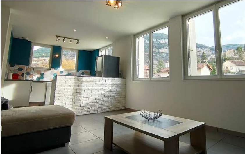
Crédit : Salon - Salle à manger