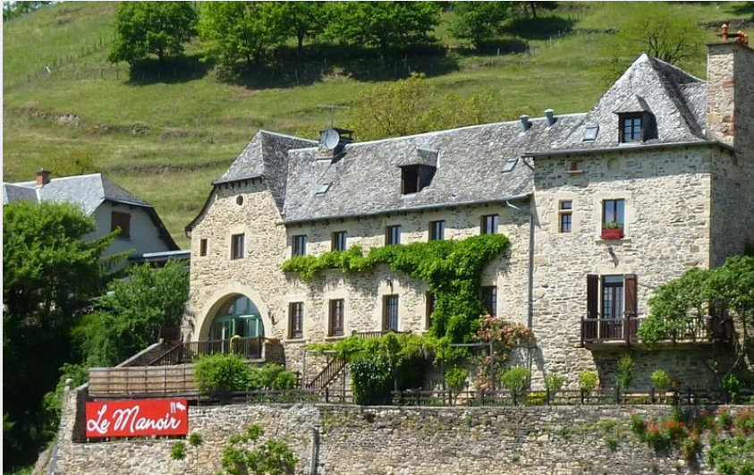
Crédit : Le manoir vu depuis la route du Lot