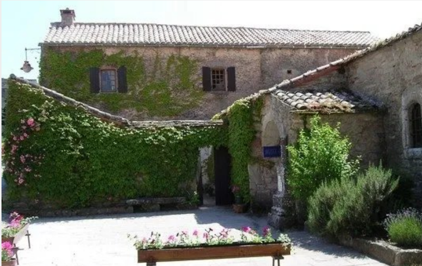
Le Presbytère de Montaigut