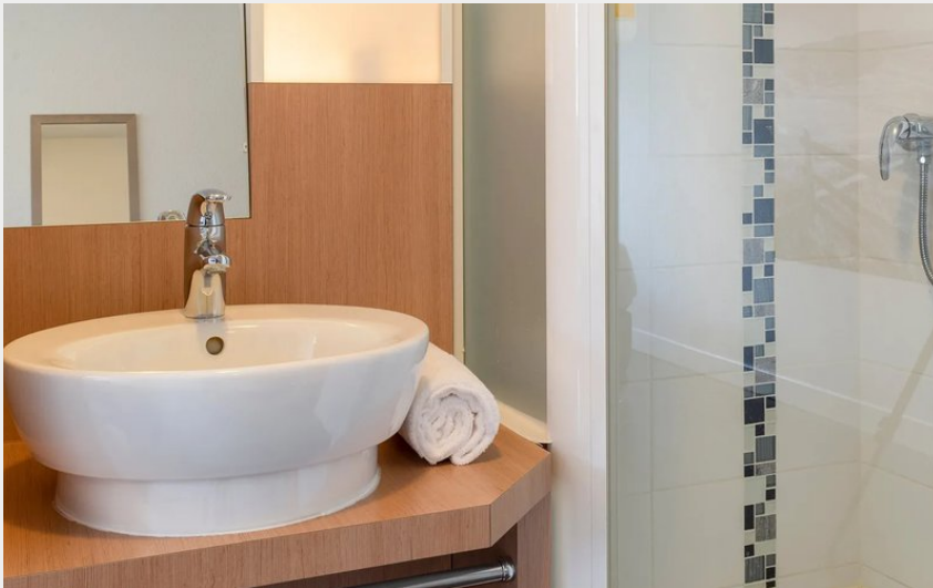
Crédit : Salle de bain