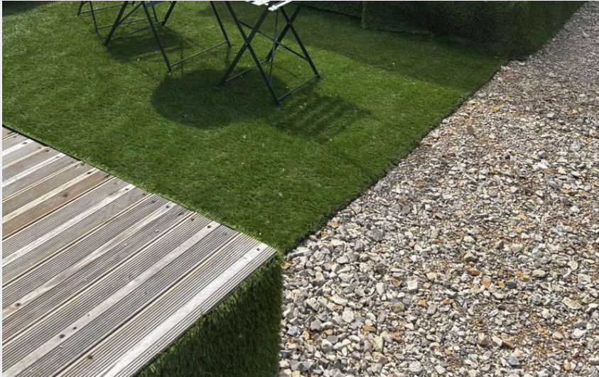
Crédit : Salle de bain et toilette sèche (Salle de bain et toilette sèche)