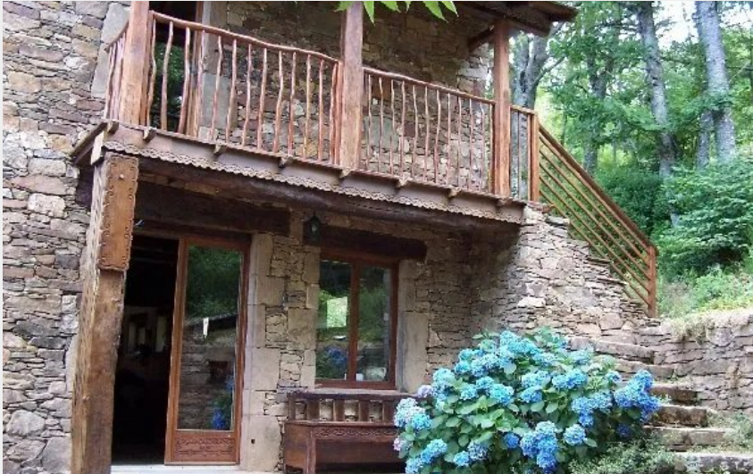
Crédit : vue entrée