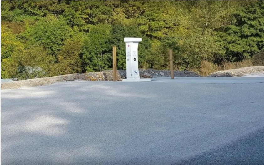
Crédit : Aire de camping-car municipale de Cénomes (Office de Tourisme Rougier d'Aveyron Sud)