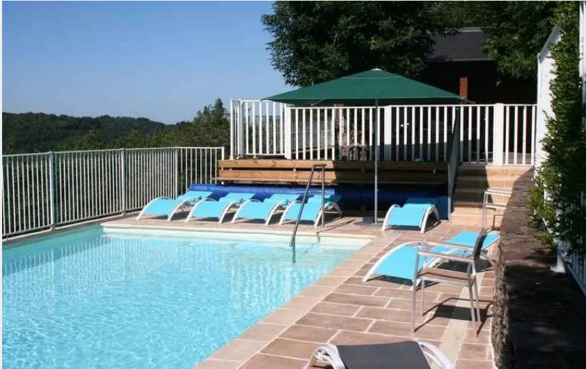
Crédit : Piscine vue côté Ouest (SYNDICAT D'INITIATIVE DES 7 VALLONS)