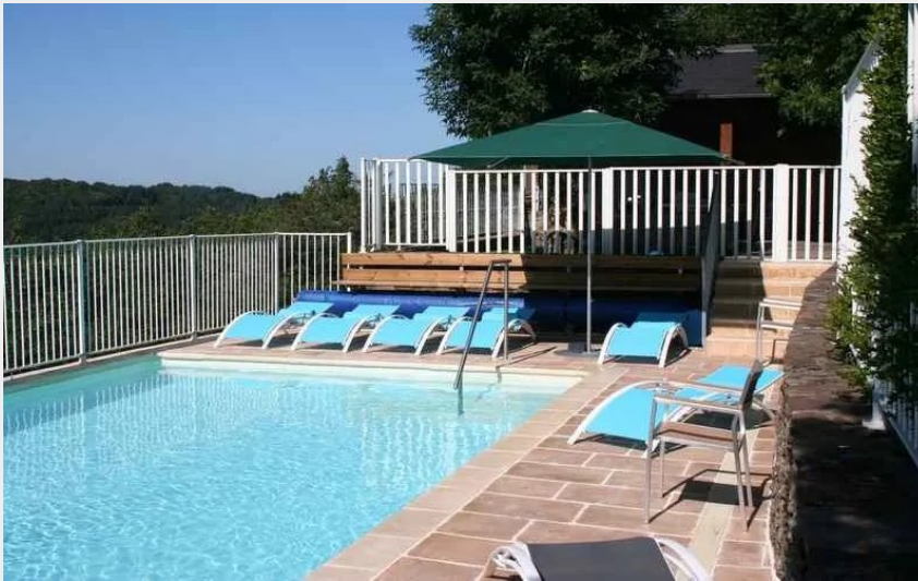
piscine vue côté ouest