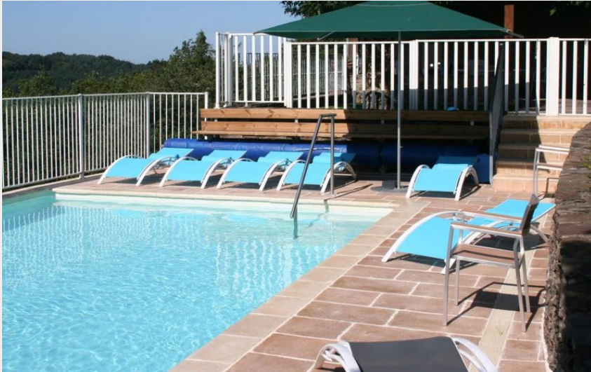
Crédit : Piscine vue côté Ouest