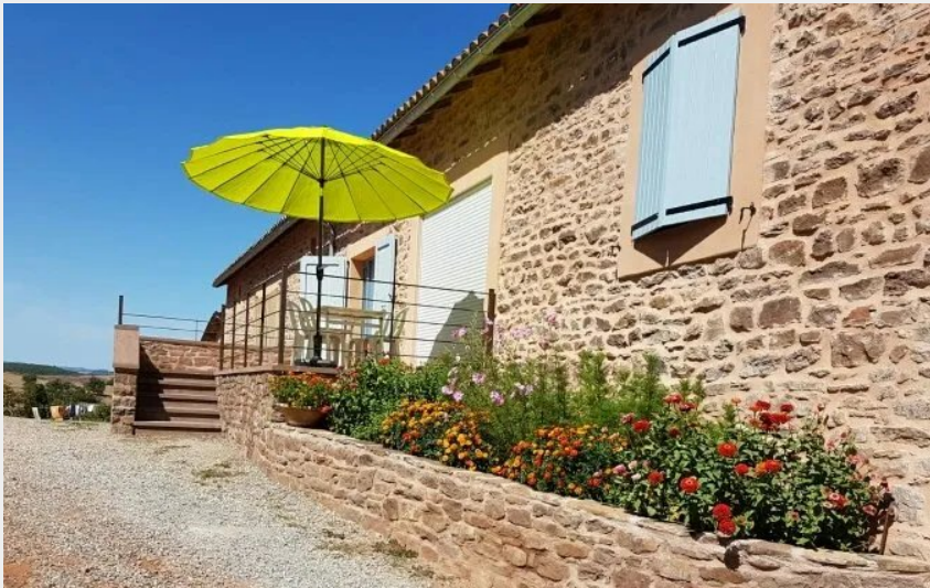
Crédit : Bâti en pierre du Rougier