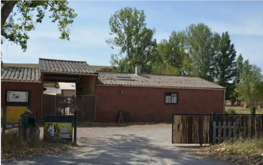
Crédit : Gîte à la ferme (Office de Tourisme Rougier d'Aveyron Sud)