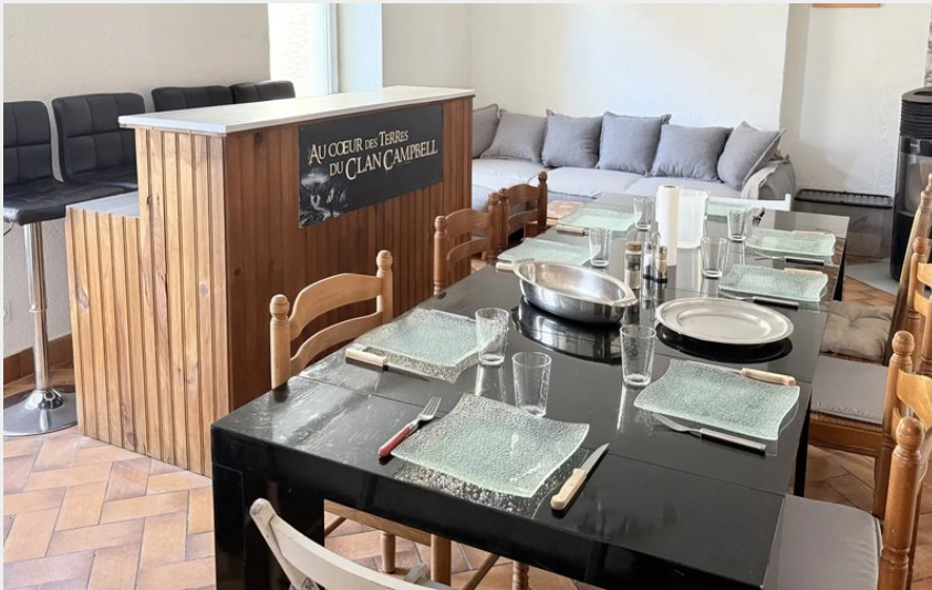
Crédit : salon coin bar avec table