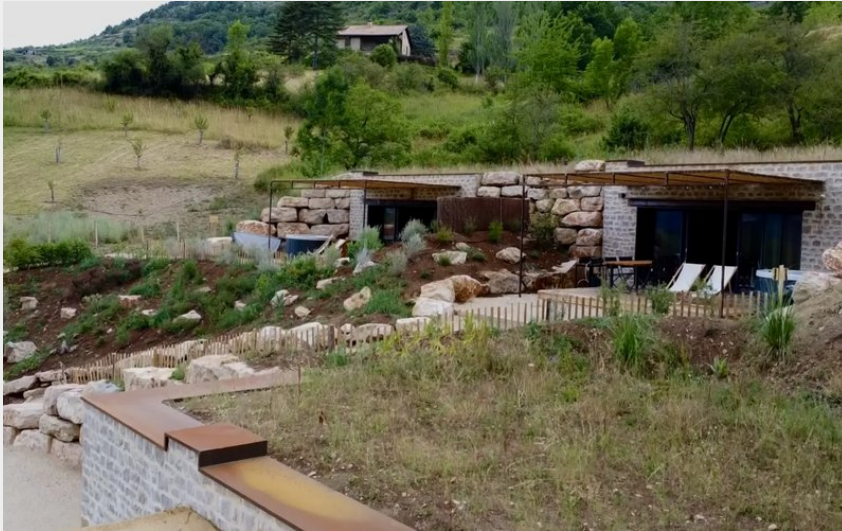
Crédit : Vue de l'ensemble