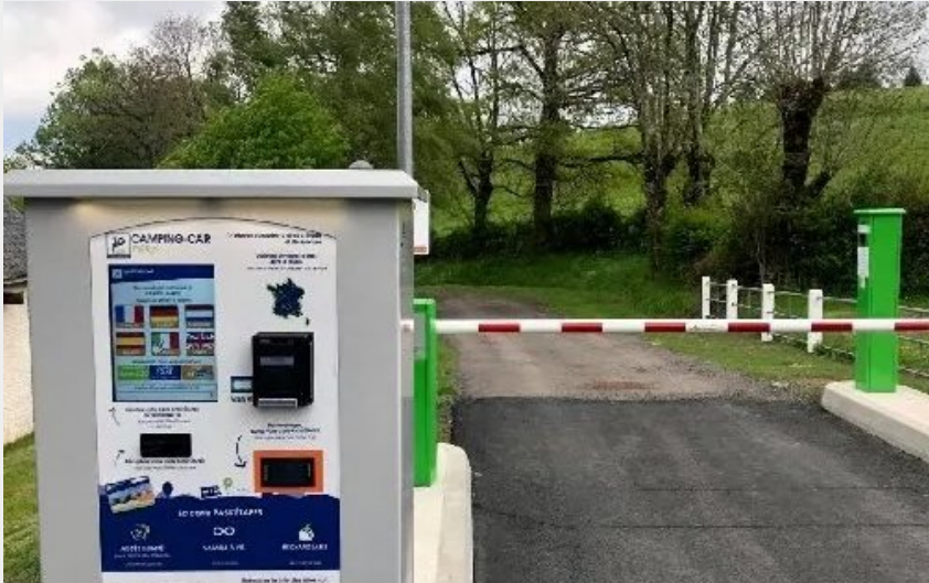
Crédit : Aire de camping-car de Mur-de-Barrez (Office de Tourisme en Aubrac)