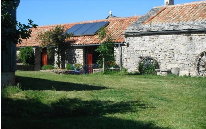
Crédit : Gîte à la ferme de L'Aubiguier (OFFICE DE TOURISME LARZAC VALLEES)