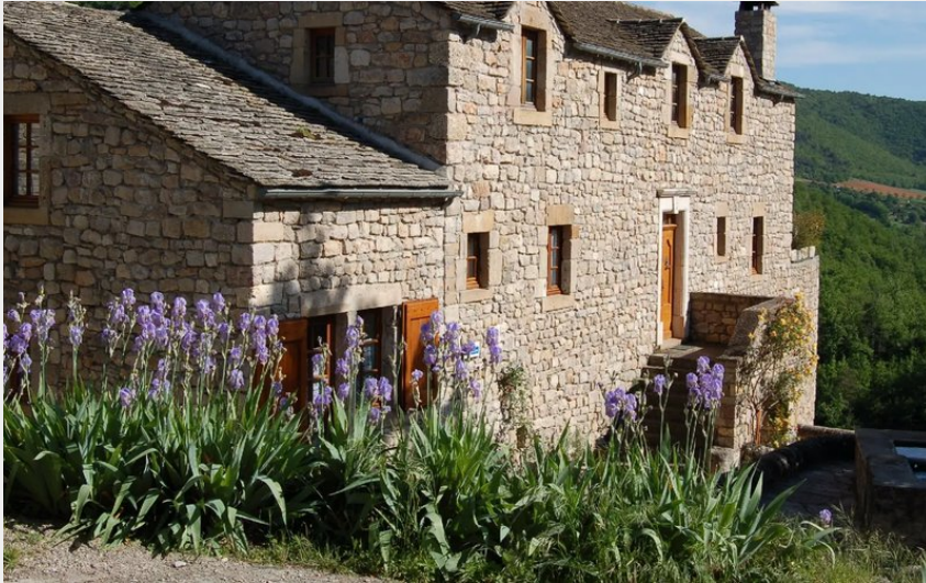
Gîte Lou Clapas sur la place de la fontaine de Cantobre