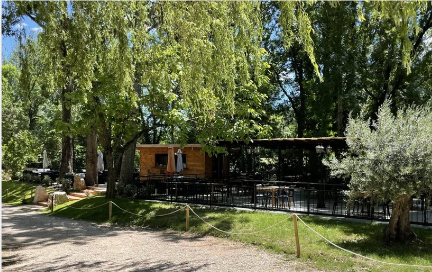
Crédit : Les Terrasses du Durzon (OFFICE DE TOURISME LARZAC VALLEES)