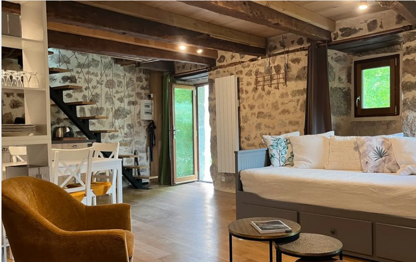
Vue de l'intérieur du gîte Le Chant de Grillon