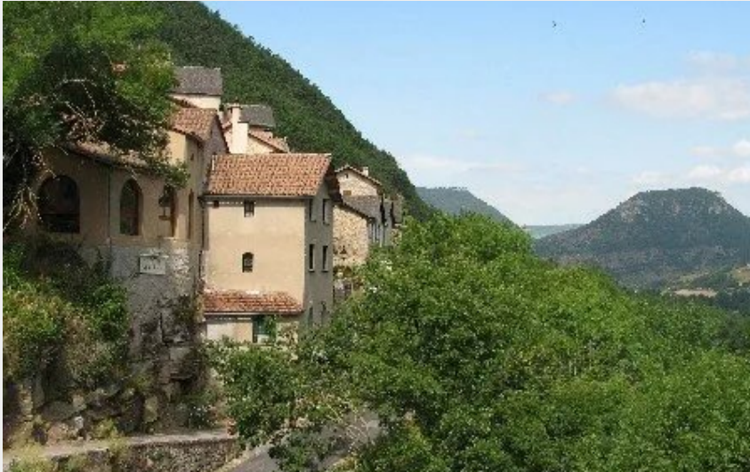
Crédit : le gîte, vue sur la vallée du Tarn (Gîte et Rando Evolutions - Les Corniches de la Jonte)