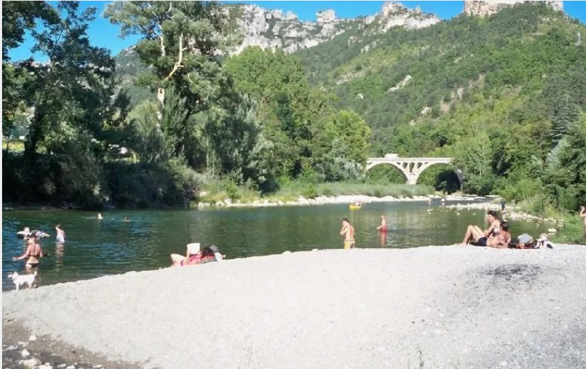
Crédit : Plage confluent Jonte/Tarn Camping Brudy-Brudy Plage** (CAMPING BRUDY - BRUDY PLAGE)