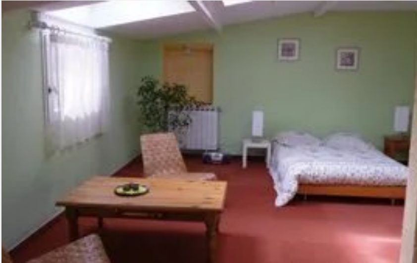
Crédit : La rose de Jéricho chambre bambou (Comité Départemental du Tourisme de l'Aveyron)