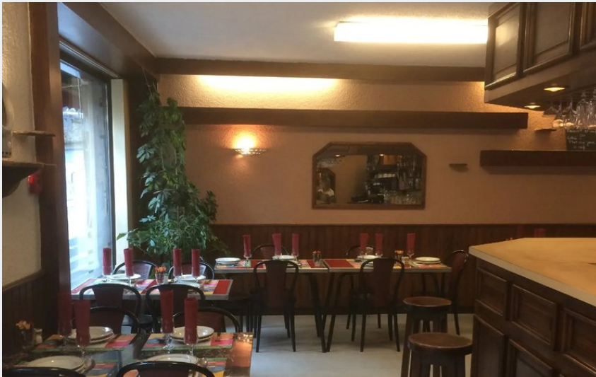
Crédit : Salle-bar restaurant - Hôtel l'Agapanthe (Hôtel l'Agapanthe)