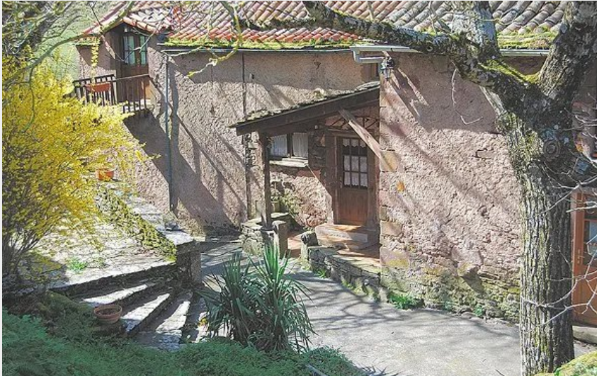
Crédit : La maison au potager (Office de Tourisme Rougier d'Aveyron Sud)