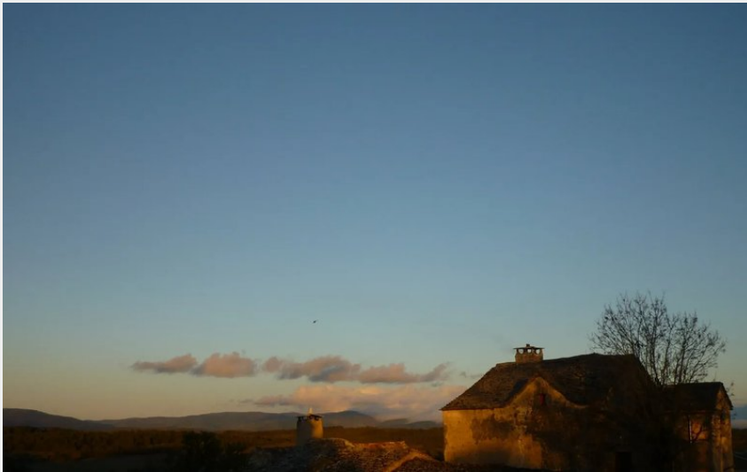
Crédit : Montredon au crépuscule