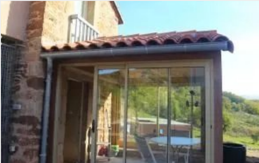
Crédit : Hameau de Bouyssi : Studio L'Oustalet (ROQUEFORT TOURISME)