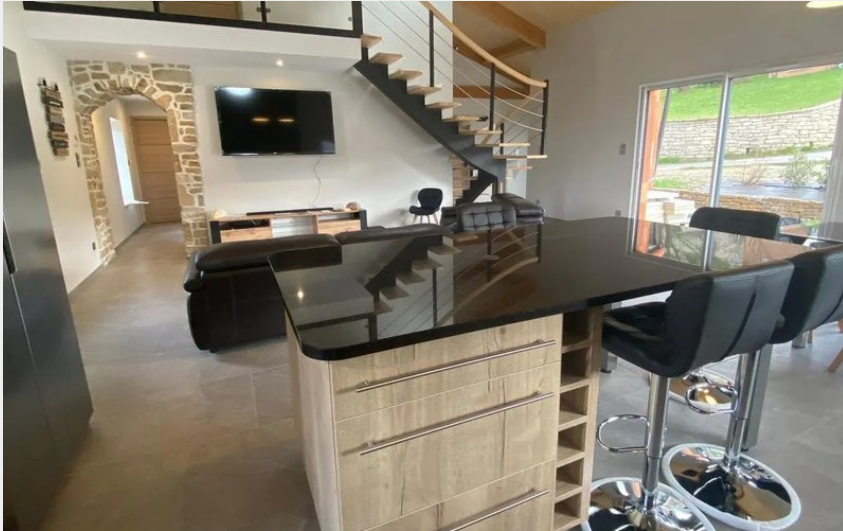
Crédit : Gîte Chez Tante Léontine (OFFICE DE TOURISME PAYS DU ROQUEFORT)