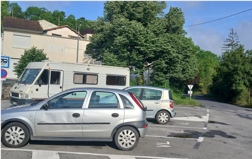
Crédit : Aire de stationnement de Saint-Affrique (Roquefort Tourisme)