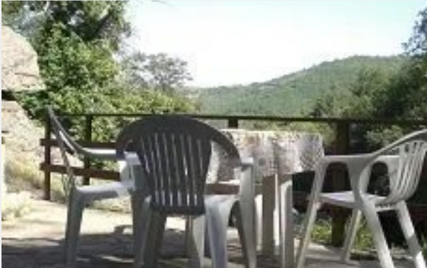
gîte 2 à 4 personnes avec véranda