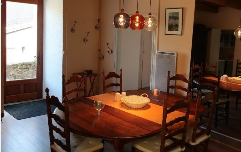
Maison dans le rempart