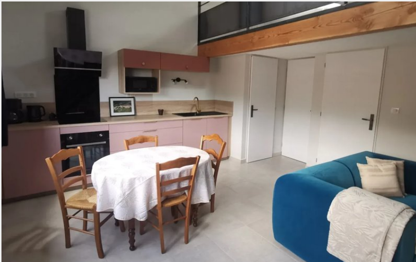
Crédit : Cuisine ouverte sur salon