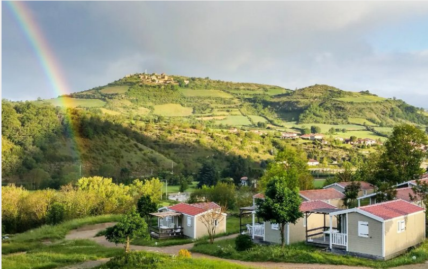
Crédit : Vue dominante sur Luzençon