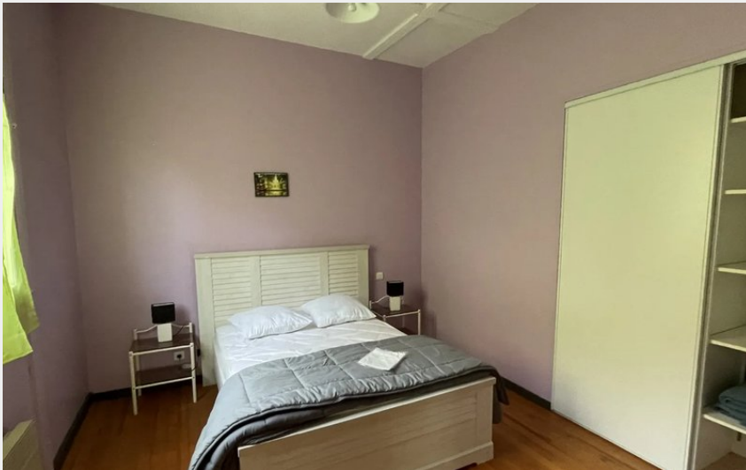
Crédit : Meublé de Couesques - Appartement n°7 (Gîte d'étape communal de Pons)