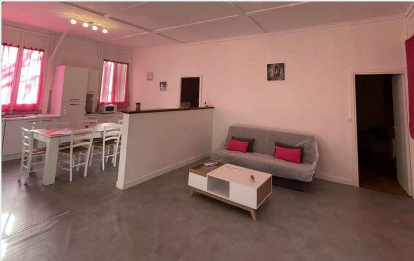
Crédit : Meublé de Couesques - Appartement n°10 (Gîte d'étape communal de Pons)