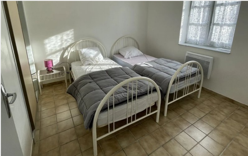
Crédit : Meublé de Couesques - Appartement n°3 (Gîte d'étape communal de Pons)