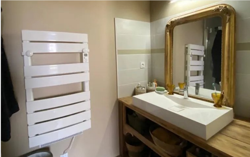
Crédit : SALLE D EAU SUITE PARENTALE