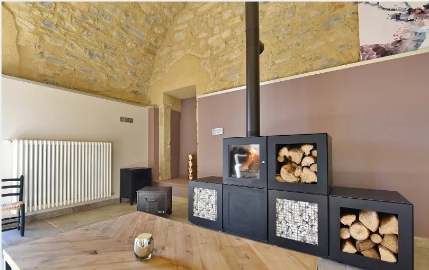
Crédit : Castel D'Alzac - Gites au Château - "Le Jardin du Château"