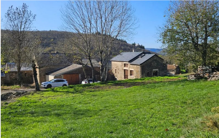
Crédit : Façade de la maison