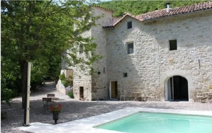
Crédit : Le Moulin de Gauty (OFFICE DE TOURISME LARZAC TEMPLIER CAUSSES ET VALLEES)