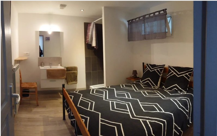
Les Trémières - Aire des marcheurs